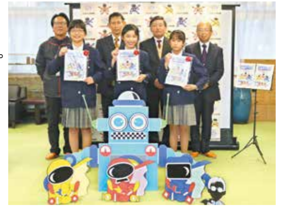
ガイドブックの執筆者4人と大野原小学校の児童