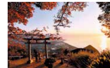
「夕映えの天空の鳥居」 三木 雅也（豊浜町）