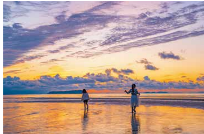
優秀賞「黄昏さんぽ」