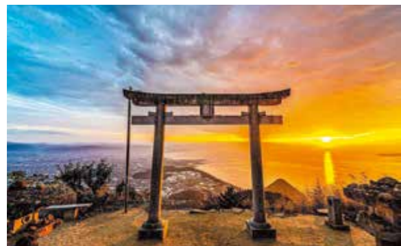
入賞「この日、神を見た。」