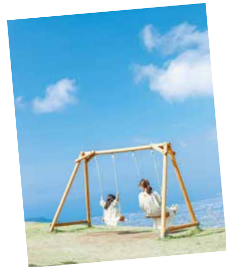
入賞「天国のブランコ」