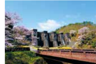
「春の豊稔池」 白川 典雄（大野原町）