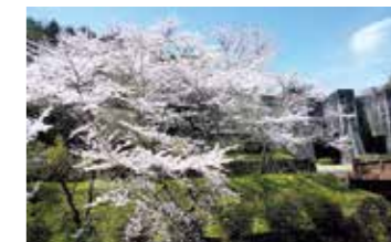
「春の豊稔池」 大西 ヨシノ（天神町）