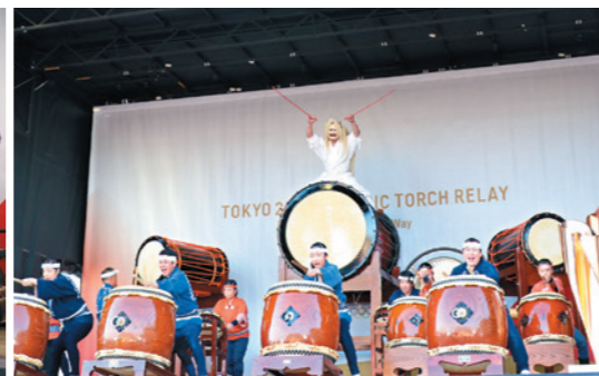
大野原轟王太鼓・観音寺女流和太鼓響音による力強い和太鼓演奏で幕開け