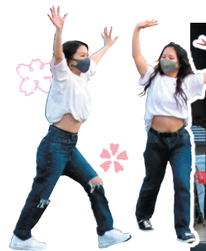
地元ダンスグループによるパフォーマンス