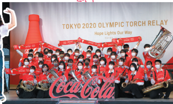
観音寺第一高校吹奏楽部が企業のオリンピック応援ソングを披露