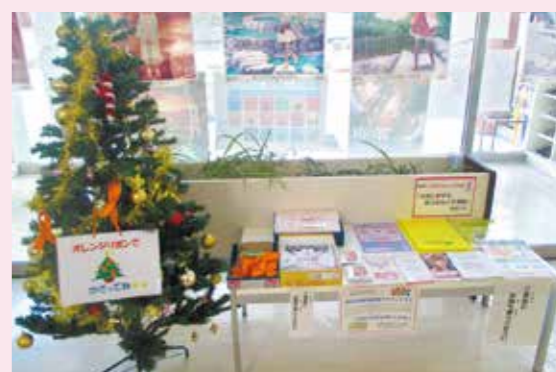
昨年の大野原図書館の様子

DVと児童虐待は密接に関わっています。女性に対する暴力根絶のシンボルマーク「パープルリボン」と児童虐待防止のシンボルマーク「オレンジリボン」を飾り付けたリボンツリーを市内図書館に設置します。ぜひお立ち寄りください。