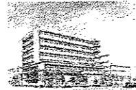
新西病棟 完成予想図

平成23年7月 新西病棟完成、地域救命救急センター(ER型)設置 ※依然として医師・看護師不足が重要課題