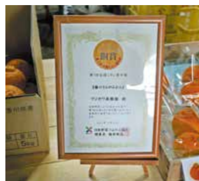
2021年12月に第1回全国ミカン 選手権で銅賞を受賞

うちは従業員も東京や大阪、 神奈川など都市部から来た移 住者ばかりで、長い人で10年 目になります。なぜ移住者が 集まってくるかは、正直分か りません。ここ数日でも県外 から2件応募がありました。 地元の人も雇いたいです。が来 ないですね。就農体験でリタ イアすることが多いです。