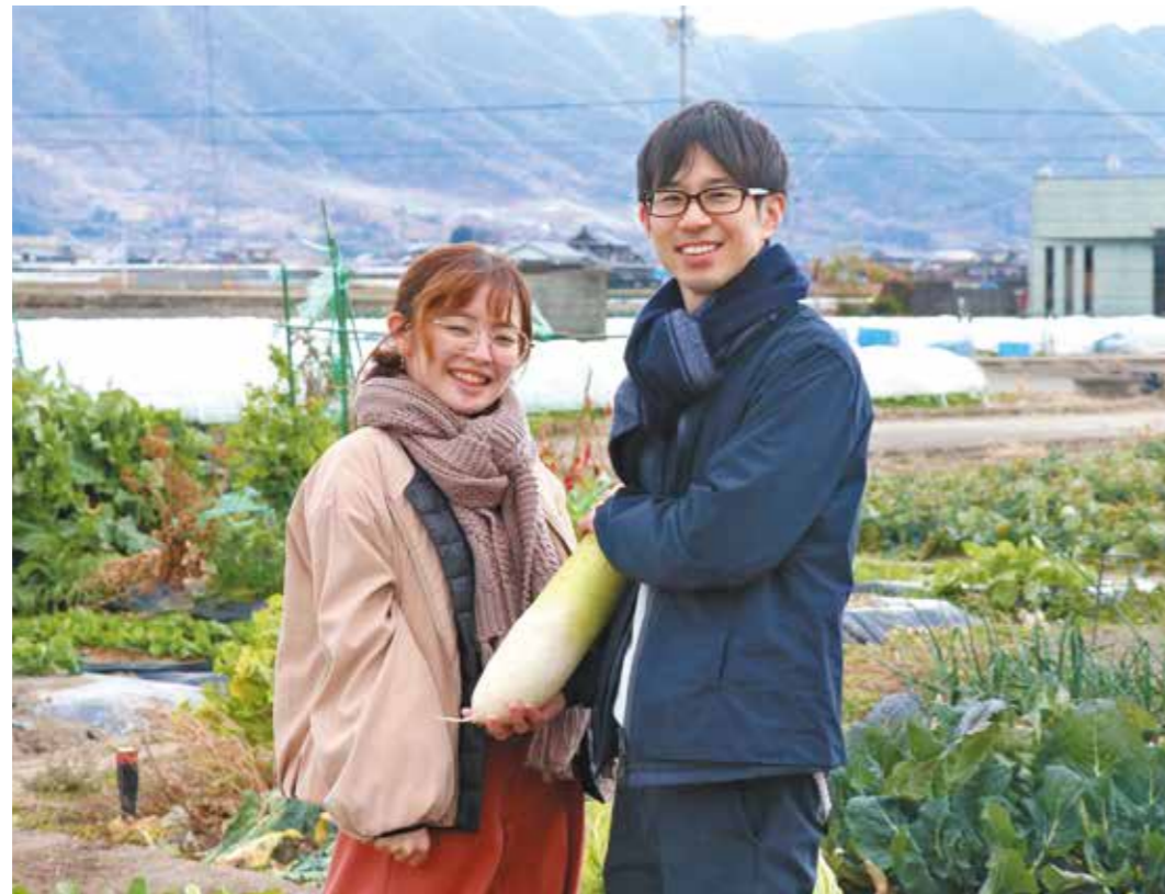
2021年 愛知県 >>>> 観音寺市