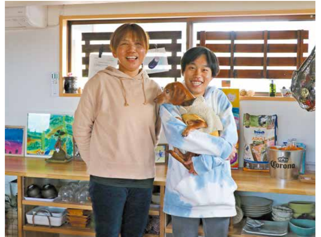
2020年 神奈川県 >>>> 観音寺市