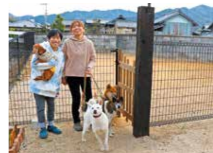
息子の幹大さんと愛犬4匹と。庭にはドッグランを整備しました

Check! 【移住フェア】 新型コロナウイルス感染拡大前までは、東京や大阪で移住フェアを定期的に行っていました。ことし2月には、オンラインで移住相談フェアを実施しました。