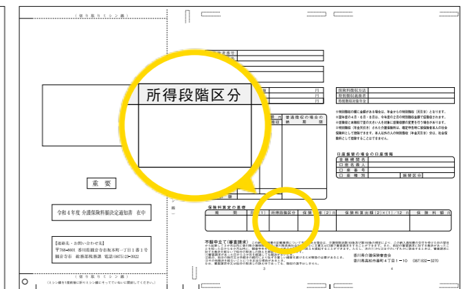
介護保険料額決定通知書