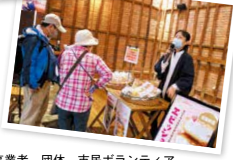
地元事業者、団体、市民ボランティアなど多くの人が運営に協力！