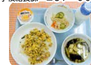
学校給食課 ☎57-6660 〈献立〉大野原学校給食センター ●三色ごはん ●切り干し大根の甘酢あえ ●豆腐汁 ●甘夏みかんゼリー ●牛乳