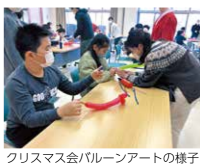
クリスマス会バルーンアートの様子

募集 わくわく体験教室 参加者募集 問 金曜日の夜または土曜日の午前中(9回程程度予定) 内 自然活動体験、科学体験、ふるさと学習、環境学習など 所 中央公民館、ふるさと学習館など 対 市内の新小学4～6年生 数 60人 料 教材費2000円 注 (内容により別途料金を集金することがあります) 受 4月17日(月)～28日(金) 小学校で配布された申込用紙に記入し、左記へ提出 問 文化振興課 ☎23-3943