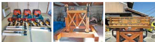
伊吹町防災クラブ 西丸井自治会 常次自治会

●常次自治会、西丸井自治会、伊吹町防災クラブ (一財)自治総合センターが行っている宝くじの助成を受け、常次自治会と西丸井自治会が備品を、伊吹町防災クラブが防災資機材を整備しました。 これらの助成事業は、コミュニティ活動の健全な発展を図り、宝くじの普及と広報を行うものです。