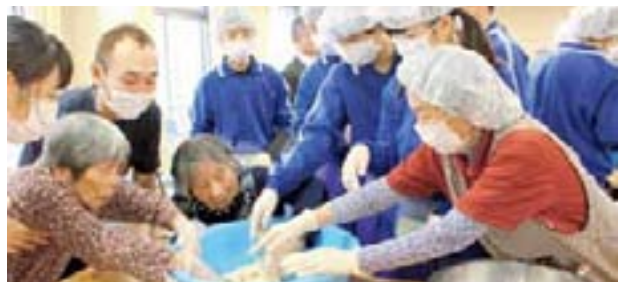
かがわマナーアップリーダーズ=自ら進んで社会の役に立ちたい中学生を県児童・生徒健全育成等連絡協議会が募集。大野原中学校は103人登録

<大中味噌味>をスローガンに掲げる大野原中学校かがわマナーアップリーダーズ28人がおおとよ荘を訪問し、みそ造りを通して高齢者と交流しました。「昔はこの家でもみそを造っていたよ」と高齢者が手本を見せながら生徒と一緒に作業。1時間ほどでみそ玉ができました。40日間寝かせ出来上がるみそは、お雑煮にして、3月上旬に中学生を招き振る舞われます。