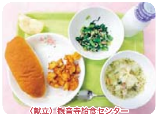
〈献立〉観音寺給食センター

観音寺地区のほとんどの小学校では毎年、新1年生を対象に給食試食会と参観が行われます。観音寺学校給食センターでは、2カ月前から試食の献立を作成しているので、試食会の献立が必ずしも全ての子どもたちにとって食べやすく楽しいとは限りません。しかし当日は、子どもたちは朝から楽しみにしているようです。家族の人にとっても、給食の量や内容などを心配している人も多く、親子ともに「ワクワク」「ドキドキ」の給食参観・試食会のようなようです。その中で、好評だった給食試食会メニューを紹介します。