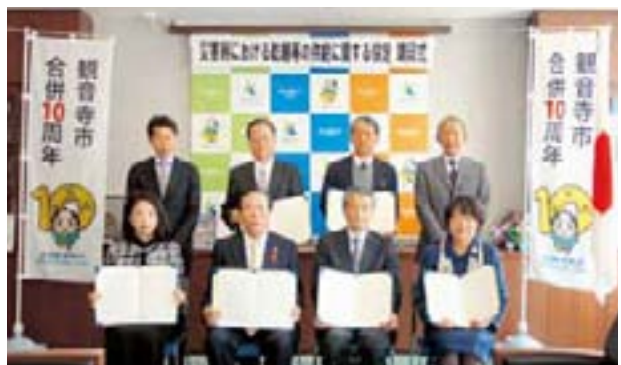
▲(株)紀州屋、(株)高原通商店、(株)マルキン、(株)合田照一商店、(株)讃岐物産、(株)讃州、(有)合田平三商店

地震や風水害等による大規模災害が発生した場合の市民の食糧確保を図るため、市は乾麺製造事業者様7社との間で乾麺等の供給に関する協定を締結しました。これにより、食糧備蓄量は増加、より充実します。