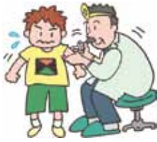
実施医療機関と実施日