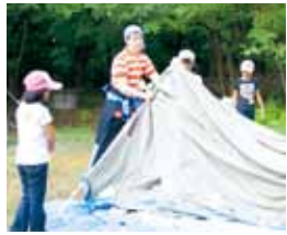
▲わんぱくトレーニングキャンプ

対 新中学1年生以上 料 1,200円(年会費) 申 学校から配布された申込用紙に記入し、生涯学習課に申し込んでください。 問 生涯学習課 23-3943