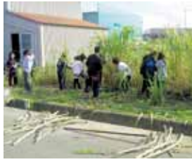
▲農作業体験 (サトウキビの収穫)

ジュニアリーダーのお兄さんやお姉さんと一緒に、農作業や科学実験など、普段できない活動を体験してみませんか。