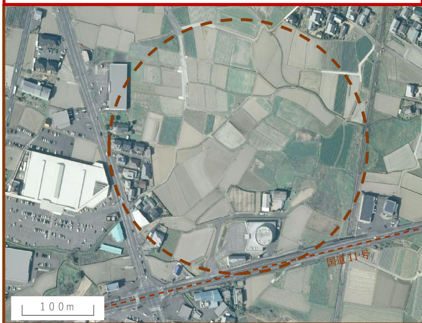
新「道の駅」かんおんじ(仮称) 建設候補地