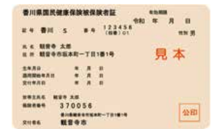
国民健康保険被保険者証