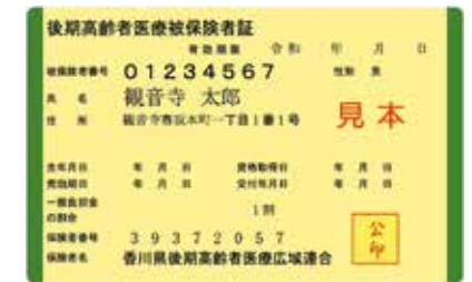
後期高齢者医療被保険者証 両端が橙色から緑色に変更