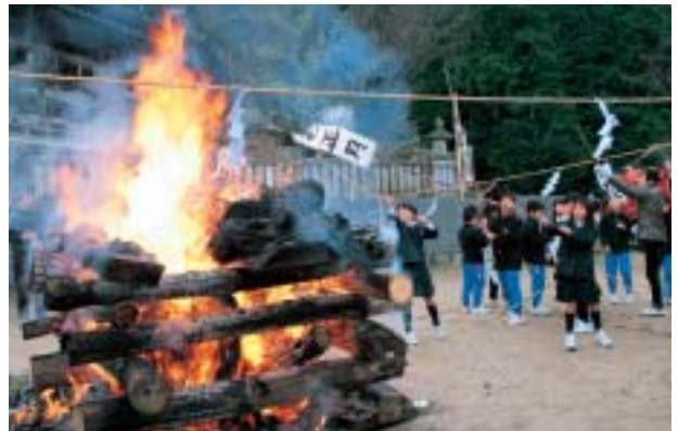
高く舞い上がりますように

粟井神社でとうとうばやしがあり、粟井小学校3年生の児童15人と粟井保育所園児らが、書き初めやミカンを竹の先に付けて燃やしました。書き初めが高く燃え上がると字が上手になり、焼いたミカンを食べると風邪をひかないなどと地域の人たちから教えてもらっていました。