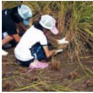
農作業体験(稲刈り)

〔注〕内容により、別途料金を徴収することがあります。 〔申〕学校を通して配布した申込用紙に記入の上、生涯学習課に提出 〔問〕生涯学習課 23 3943