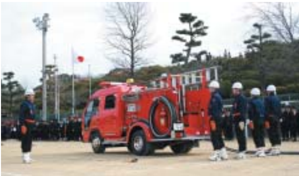
きびきびとした動作で演技

市消防団出初式が、総合運動公園で市内の23分団635団員が参加して行われました。白川市長は、日々の団員の労苦に対して市長表彰や永年勤続表彰などをし、感謝の言葉を贈りました。その後消防車などの閲団に続き消防操法や一斉放水。団員たちは、市民の安心と安全を守るため、引き締まった表情で操法などを披露していました。