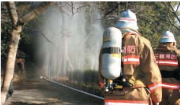
本番さながらに訓練

文化財防火デーを迎えるに当たり、国の財産である文化財を火災やその他の災害から守ろうと消防訓練が行われました。69番札所観音寺金堂から出火したと想定して、市消防団員や三豊広域消防隊員34人が消火活動。炎の延焼を防ぐため、水幕ホースなどを使って、きびきびとした動作で訓練にあたっていました。