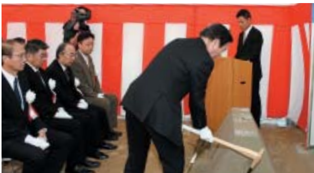
白川市長によるくわ入れ

中部中学校で、校舎等改築（校舎棟建設）の起工式が行われ、白川市長や生徒代表ら90人が出席しました。緊張感と静けさにつつまれた中で、出席者全員が、これから始まる工事の安全を願っていました。全校生徒らが待ち望む新校舎の完成は来年3月の予定です。