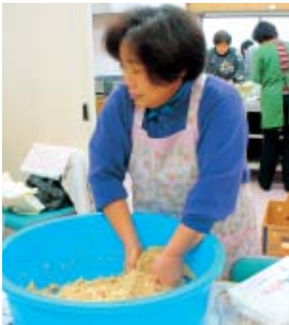
よくこねるのが、おいしく作るコツ

豊浜町公会堂で、豊浜町婦人会の皆さんが手作りみそを作りました。素材にこだわり、北海道大豆と観音寺特産のこうじを使用。よくもみほぐしたこうじに蒸した大豆と塩を入れ、そこに少しずつ水を入れて