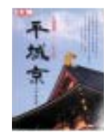
平城遷都1300年記念 平城京 監修: 千田稔 出版: 平凡社