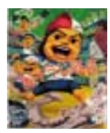
絵本「おそうじ隊長」 作: よしながこうたく 出版: 長崎出版