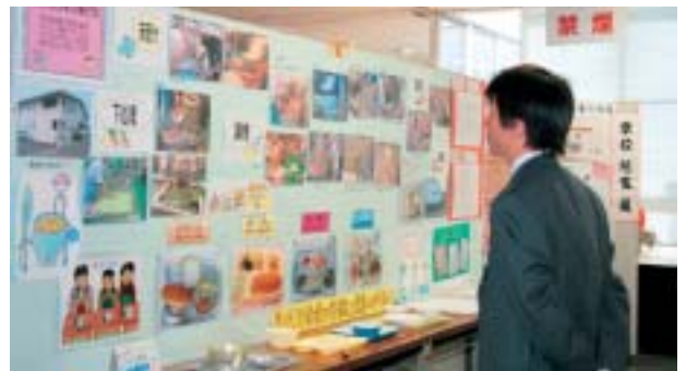
懐かしい給食に足を止める

学校給食週間（1月24日～30日）に合わせて、市役所1階ロビーで学校給食展が開かれました。学校給食の意義、役割、年代別給食の特徴、食器の移り変わりなどのパネルを展示。給食献立の紹介や給食ができるまでのビデオも放送していて、興味ある内容に来庁者は足を止め見入っていました。