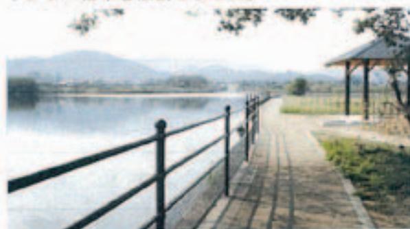
▲水と触れ合える公園

地域用水環境整備事業で整備をしていた一ノ谷池親水公園が完成し、しゅん工式が行われました。公園には広場やトイレ、東屋、遊歩道、サクラ並木、アジサイロード、ショウブ園などがあり、地域住民の憩いの場として、また水生動植物の観察場所として利用。式で白川市長は「平成16年度に着工した事業が完成。地域住民に親しまれる公園にしてください」とあいさつし、関係者とともにサクラの苗木を植樹しました。