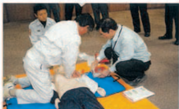
▲真剣に取り組んでいました

観音寺ライオンズクラブから贈られたAED（自動体外式除細動器）5台を本庁舎や支所などに配備したのを受けて、市職員が普通救命講習を受けました。災害の際、職員が市民の安全を確保したり、応急処置をしたりできるようにするのが狙い。救命士の指導の下、ダミー人形を使って人工呼吸の仕方やAEDの扱い方などを習得しました。