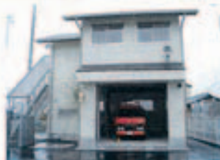
▲ すぐ出動できます