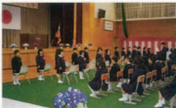
▲ 6年生の代表が歓迎の言葉を贈りました

栗井小学校で入学式があり、18人が小学生の仲間入りをしました。在校生や保護者が見守る中、花のアーチをくぐり上級生と手をつないで入場。式では、校長先生が「あいさつをしましょう、仲良くしましょう」などと式辞。来賓のお祝いの言葉を緊張した面持ちで聞いていました。同日、栗井小学校を含む13市立小学校で一斉に入学式があり、573人が小学生の仲間入りをしました。