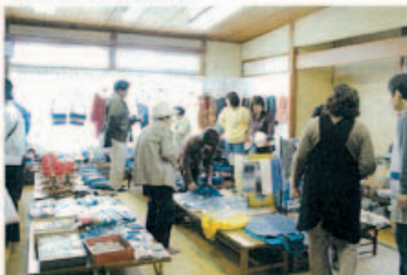
▲ 気に入ったものを買って求めています

一ノ谷小学校前にあるやまもも作業所で「地域ふれあいの日」のイベントがありました。通所している人たちや父兄の作品展示などがあり、大勢の人たちが見入っていました。また、ボランティアの人たちが手作りしたすしやうどん、沖縄ドーナツなどの販売もあり、朝早くから地域の人たちでにぎわっていました。