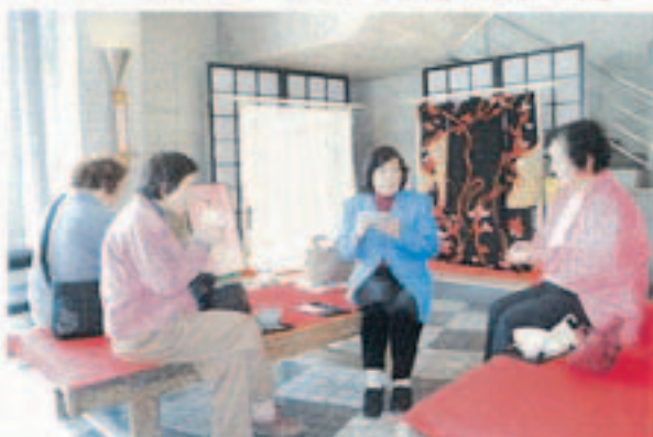
▲ おいしくいただきました

総合コミュニティセンターで観音寺商工会議所女性会主催のチャリティさくら茶会がありました。訪れた人たちは、さくらの花に見立てたお菓子を食べながら香り豊かな抹茶を味わったり、桜の花を愛でながら竹の子ごはんや菜の花などが入った弁当を食べたりしていました。収益金の一部は社会福祉事業などへ寄付する予定だそうです。