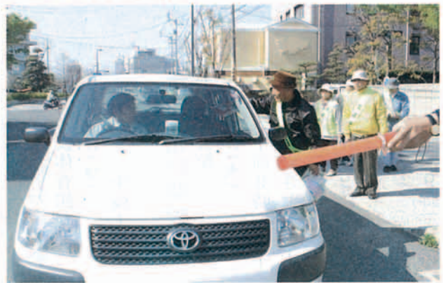
▲一人ひとりに声掛け

県立観音寺中央高等学校前で市老人クラブ連合会観音寺支部の理事ら約30人が、交通事故防止を訴えました。これは春の全国交通安全運動の一環で、交通安全について考え、正しい交通ルールの実践と交通マナーの向上を図るのが目的。運転者一人ひとりに交通事故防止のパンフレットと記念品を手渡ししながら「安全運転をお願いします」と声を掛けていました。