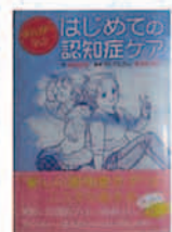
はじめての認知症ケア 高瀬直子(豊浜町出身)/作 小学館