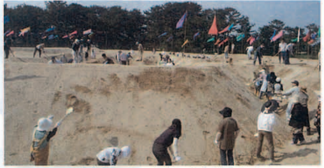
▲ みんなの力できれいになりました

春季恒例の銭形の砂ざらえがあり、約400人のボランティアが参加。琴弾山山頂からの指示に従い、スコップで砂をかき上げたり、字の角を作ったりしました。少し蒸し暑かったため、汗だくになりながらの作業になりましたが、昼前には、新緑の松林の中に「寛永通宝」の字がくっきりと浮かび上がりました。ボランティアの皆さん、ありがとうございました。