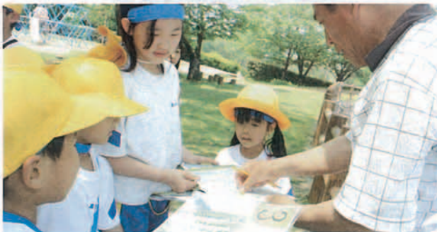
▲ ポイントを協力して通過

総合運動公園で豊田小学校の新生歓迎ウォークラリーがありました。遠足を兼ねて新一年生27人を歓迎しようと全児童179人が参加。学年を超えたグループを作り、各ポイントで「じゃんけん」や「しりとり」などに次々と挑戦。どのグループも力を合わせてゴールを目指していました。このウォークラリーで、楽しい時間を過ごすとともに体力づくりや仲間づくりもできました。