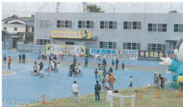
▲バンク内ではスピードが出るよ

競輪場に親しみを持ってもらおうと銭形くん春まつり'08を開催しました。この日は、普段入ることのできないバンク内を開放。家族連れで訪れた人たちは銭形くんふわふわドームで遊んだり、おもしろ自転車などに乗って楽しんだりしていました。固定自転車のスピードチャレンジやプロ選手の模擬レース抽選会などにも多くの人たちが参加。このほか物産品の販売もあり、イリコやレタス、花などを買い求めていました。