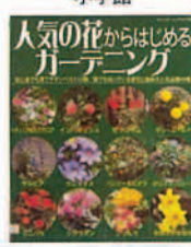
人気の花からはじめるガーデニング じゅわ樹/編 ブティック社

◆毎月入荷している新着本のリストを掲示しています。 中央図書館 ☎23-3960 大野原図書館 ☎54-5715 豊浜図書館 ☎52-1206