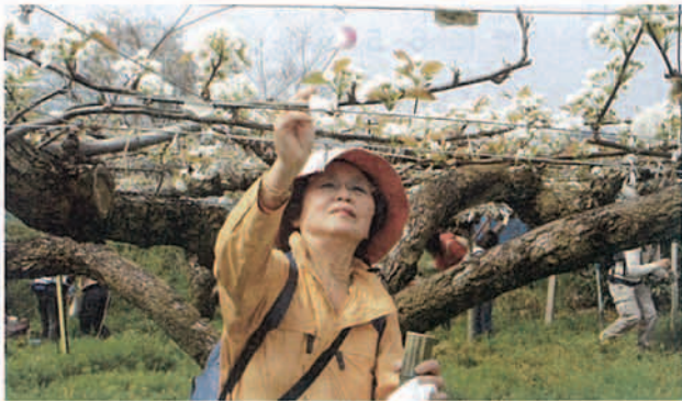
▲「ぼんてん」で花粉を付けました

観音寺市観光協会主催の「梨づくり体験ツアーINかんおんじ」に市民ら約60人が参加しました。豊浜町和田の「梨観光農園」で専門家から受粉作業などの説明を受けた後、作業を開始。受粉に適した花を探して次々と「ぼんてん」で花粉を付けたり、余分な花を取り除いたりしました。作業の後、白いナシの花が咲く中を大谷やすらぎ公園までゆっくり散策しました。5月上旬に摘果、8月上旬に収穫作業を体験する予定です。