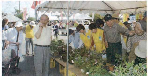
▲ 大勢の人たちでにぎわっていました

豊浜駅構内約200本のツツジが見ごろを迎え、駅前広場で地元須賀自治会主催の「つつじ祭り」がありました。運営に須賀青年会や婦人部、子ども会などが協力。訪れた大勢の人たちは、ツツジの前で記念写真を撮ったり、手作りもちや花、野菜などを買い求めたりしていました。昭和15年に植えられたツツジは、駅の無人化に伴い須賀自治会が手入れや除草などを行っています。