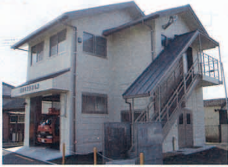
▲ 完成した東分団屯所

市消防団観音寺東分団の屯所が完成し、消防団員など関係者が参加して落成式が行なわれました。これまでは駐車場がなかったため、消防団活動に支障が出ていましたが、新築移転することで駐車場が確保でき、迅速な出動や円滑な消防団活動ができるようになりました。これからも地域住民の生命と財産を守るための地域消防防災活動の拠点になります。