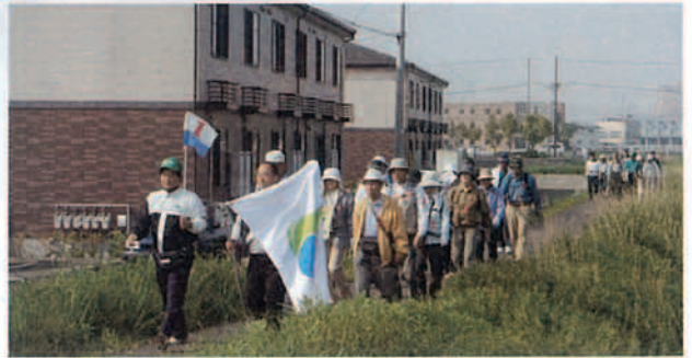
▲ 元気に出発しました

初夏を思わせる天候の中、琴平町の高灯ろうを目指して歩く「市民健脚大会」がありました。家族や友だちなどで参加した約50人は、午前8時20分に市民会館前を出発。道沿いの木々や花々を見ながら、それぞれのペースで歩いていました。午後2時30分ごろには全員がゴール。健脚証をもらい、お互いに健闘をたたえていました。