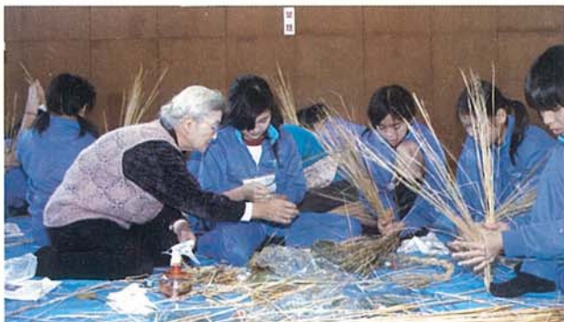
▲ 手と足を使って作りました

豊浜小学校で市女性団体連合会主催のしめ縄作りがありました。伝統行事を学ぶとともに地域の人たちとの交流が目的。6年生の児童78人は、地元長寿会の人たちから「しめ飾り」のいわれや作り方を聞いた後、しめ縄作りに挑戦。稲わらをよる作業は初めてとあって、どの児童も悪戦苦闘。長寿会の人たちから手を水で湿らせるなどのアドバイスをもらおうと、戸惑っていた児童たちもすぐこつをつかみ、次々と仕上げていました。