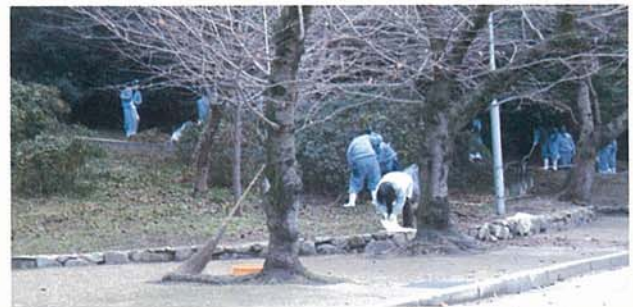
▲ 雑草や枯れ葉が除かれ、きれいになりました

県立笠田高等学校の生徒ら約270人が琴弾公園内で清掃などの奉仕をしました。この活動は昭和40年に有志の生徒が始め、以後1年生が中心に活動を継続。ことしは1・2年生が参加し、松の枯れ葉をくま手などでかき集めたり、木々の枯れ葉を竹ぼうきなどで掃き集めたり。集めた枯れ葉などは大きなごみ袋に詰め、一輪車などで運び出していました。