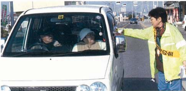
▲ ゆっくり走ってくださいね

大野原町辻東交差点で、市交通安全母の会主催の年末年始交通安全キャンペーンが行われました。参加したのは母の会のメンバーら約30人。「気を付けて運転してください」「安全運転をお願いします」と声をかけながら、交通安全のパンフレットや反射材のついたリストバンドなどを運転手に手渡していました。みんなで交通ルールを守り、安全運転を心掛けましょう！