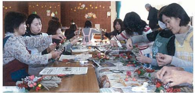
▲ 和やかに交流をしながら作っていました

豊浜幼稚園で家庭教育学級主催のお正月飾り（リースとアレンジメント）作りがありました。家庭教育学級は保護者同士が交流を深め、子育てなどの情報交換をし、楽しく学び合うことを目的に自主運営をしています。希望した保護者26人は、手本を参考に材料の組み合わせを工夫したり、教え合ったり。1時間余りで、センスあふれる作品が次々と出来上がりました。