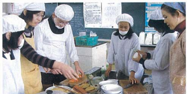
▲ 慣れない手つきで野菜切り