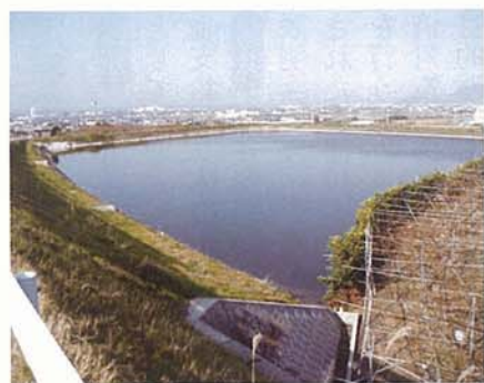
▲整備されたため池

道路整備事業補助金交付要綱、旧豊浜町では土木費補助金要綱で対応している。 今後、各自治会に整備要望調査を行い現状を把握したい。また、整備の補助金交付要綱の改正も検討したい。 香川県の「第9次老朽ため池整備促進計画」について 質問 県が、先日発表した「第9次老朽ため池整備促進計画」の内容を伺う。本