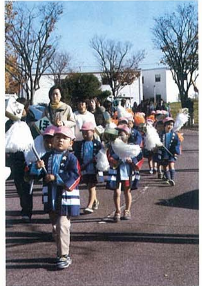
▲ 元気よく大きな声で呼びかけました

大野原幼稚園幼年消防クラブの園児や保護者約280人が防火パレードをしました。園児らはまといやポンポンを持ち「寝たばこはやめてください、ろうそくの火は消しましょう」など、拍子木に合わせて大きな声で火の用心を呼びかけました。また、この日は本物の消防自動車が園庭に。園児らは「すごいなあ」「電話がついとるよ」「太いホースやあ」などと驚きの声を上げていました。