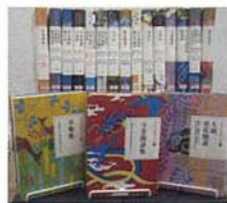
日本の古典をよむ 全20冊 出版：小学館

中央図書館 ☎23-3960 大野原図書館 ☎54-5715 豊浜図書館 ☎52-1206