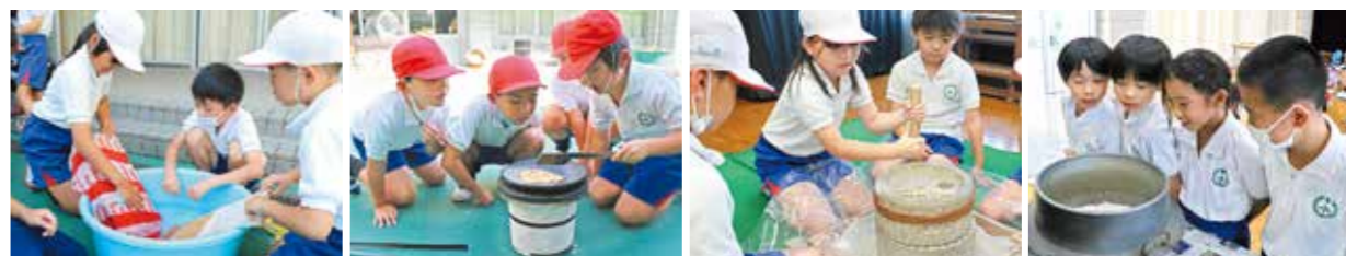
昨年度参加した、坂出市立加茂小学校のワークショップの様子