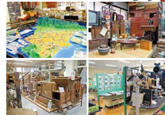
多様な展示コーナーをお楽しみに

開館時間 午前9時～午後5時 (入館は午後4時30分まで) 休館日 毎週月曜日(祝日の場合はその翌日) 年末年始 入館料 無料 所在地 大野原町丸井313番地(旧紀伊小学校) 問い合わせ先 ☎24-8123