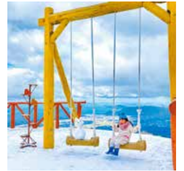
「一緒にブランコ楽しいね」