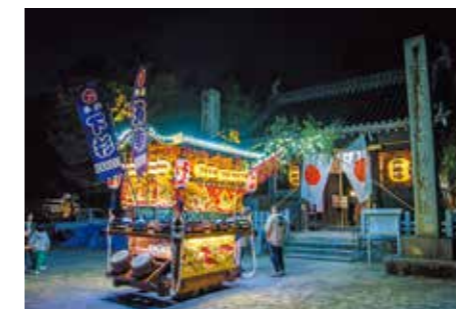
「大野原八幡神社秋季大祭」