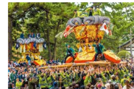
「よっさい！よっさい！」