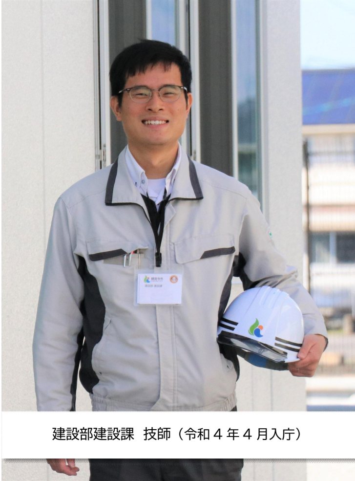
建設部建設課 技師（令和4年4月入庁）

前職で民間企業に勤務していましたが、家庭の事情などもあり転職を決意しました。仕事の成果が直接誰かの役に立つ仕事がしたいと思い、公務員を志望しました。そのような時に観音寺市で建築職の募集をしていることを知りました。観音寺市はコンパクトシティが形成されており、ここでなら豊かな自然の維持や住宅が密集する都市部の整備など、全体に目が行き届いた行政サービスを行っていけると考え、受験しました。