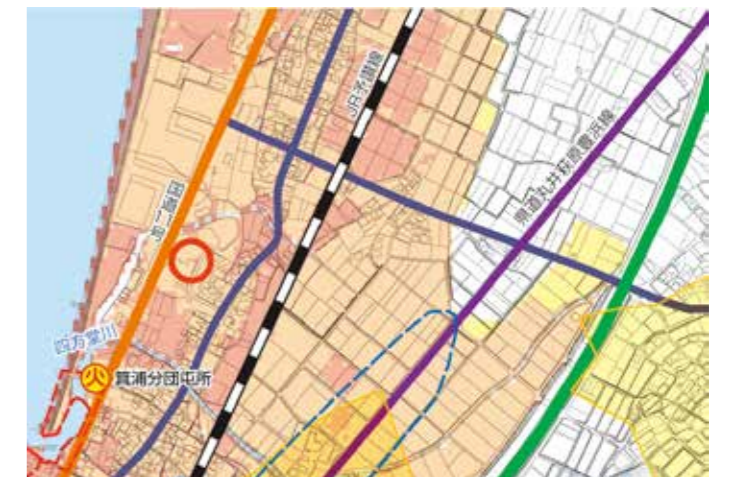
※総合防災マップ55ページより抜粋