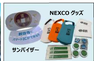
配布予定のグッズ