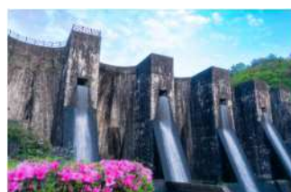
観音寺市観光名所 (豊稔池堰堤)