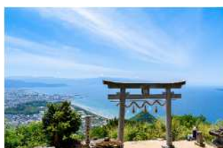
観音寺市観光名所 (高屋神社~天空の鳥居~)