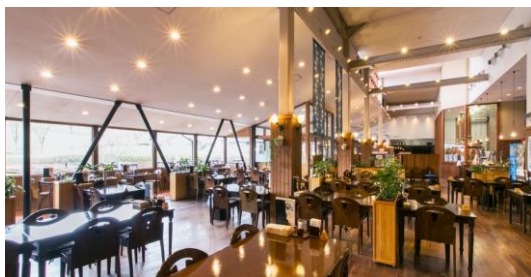
▲軽飲食フードコート・地産地消レストラン