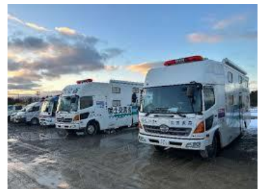
▲災害対応車両基地