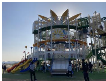
▲大型屋外遊具