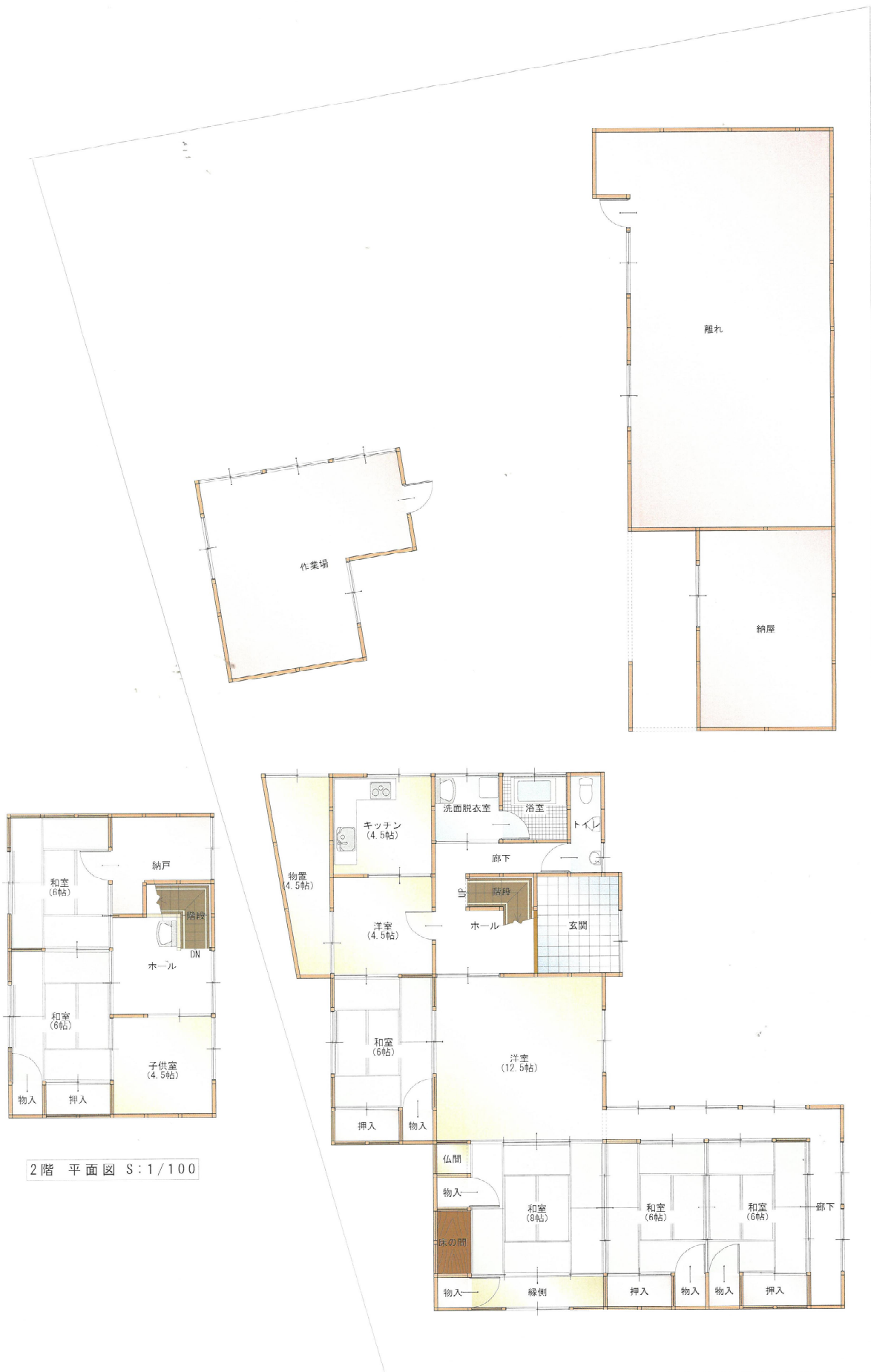
2階 平面図 S:1/100