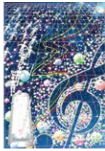
昨年度採用デザイン

令和9年1月31日(日)開催予定の「第20回観音寺市民音楽祭」のポスターやチラシ、プログラムのデザインを募集します。最優秀作品は基本デザインとして活用し、応募作品は音楽祭当日に会場で展示します。