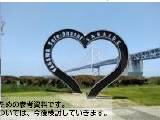
▲道の駅くるくるなと

この写真は、導入機能をイメージするための参考資料です。 新「道の駅」に導入する機能の詳細については、今後検討していきます。